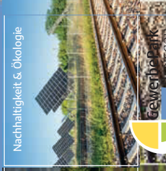
Nachhaltigkeit & Ökologie